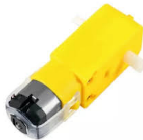
Motorreductor con engranajes de plástico